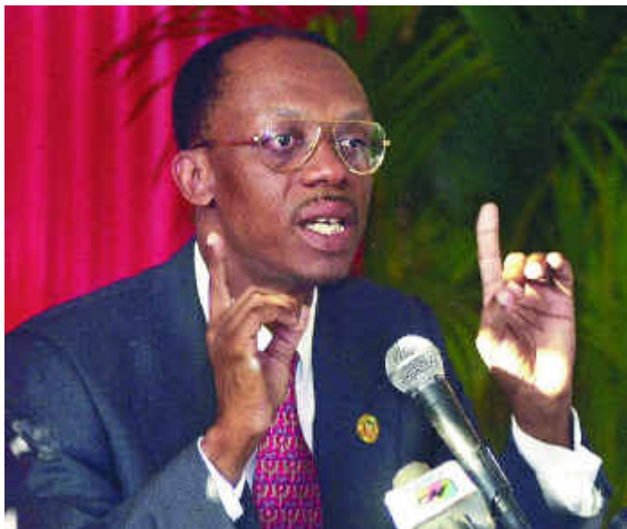
Jean-Bertrand Aristide.

Valgets vinder, den karismatiske præst Jean-Bertrand Aristide, blev indsat som præsident i februar 1991, men blot syv måneder efter blev han styrtet ved et kup, der var ledet af general Raoul Cédras. Derefter fulgte tre års brutalt styre af en militærjunta, ledet af Cédras, før et kraftigt internationalt pres og endnu en amerikansk invasion og besættelse i 1994 gav magten tilbage til Aristide. En af den genindsatte Aristide-regerings første handlinger var at opløse hæren, hvilket vakte stor folkelig begejstring.